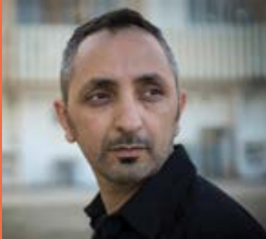
צילום: יוטי צבוקר